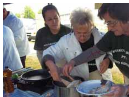
Rybobranie 2014 r. Konkurs o Wazę Wodnika