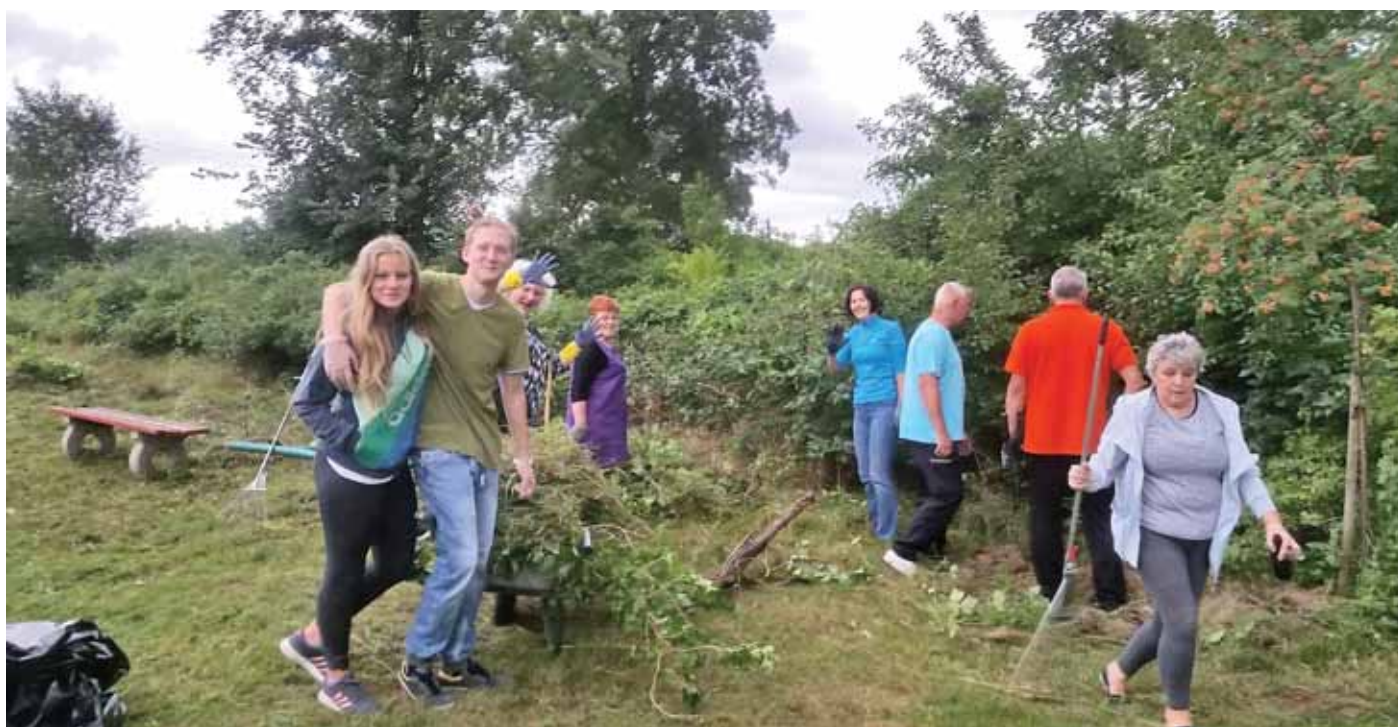
Stowarzyszenie Przyjaciół Świecka podczas wspólnego sprzątnięcia swojej wioski: tak w zeszłym roku powstawał park.

Organizacje pozarządowe nazywane są NGO'sami, od angielskich słów: non governmental organisation. A także trzecim sektorem, w odróżnieniu od dwóch pozostałych, czyli administracji publicznej i biznesu. To trzecia „społeczna noga”, tworzona przez zwykłych ludzi. Zwykłych, choć wielu bardzo niezwykłych. Opis tego, czym są fundacje i stowarzyszenia jest na str. 5