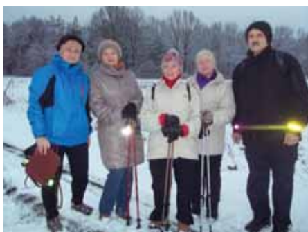
Nordic Walking 2015 r.