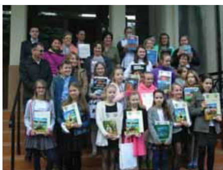
Konkurs Poznajemy Ojcowiznę 2015 r.