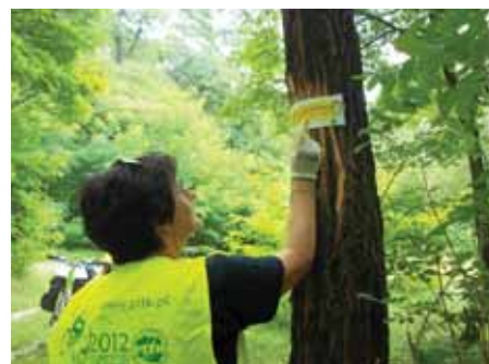
Zankowanie żółtego szlaku pieszego Krosno Odrz. - Nietków 2016 r.