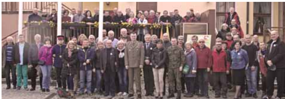
XXXI Seminarium Krajoznawcze Wojska Polskiego „Fortyfikacje Polski Zachodniej” – 2017 r.

Największą popularnością wśród naszych członków cieszą się imprezy rowerowe, spacery Nordic Walking, rajdy samochodowe i autokarowe podróże wojskowo-historyczne. Zorganizowaliśmy również imprezy turystyczne, ogólnopolskie: „Złot Przodowników Turystyki Kolarskiej” – 1997 r., XXXIII Centralny Złot Turystów Wojska Polskiego „Ziemia Lubuska – 2004” i XXXI Seminarium Krajoznawcze Wojska Polskiego „Fortyfikacje Polski Zachodniej” – 2017r.