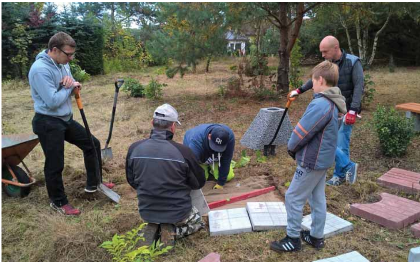
W Kunowicach (powiat słubicki) dzięki dofinansowaniu pozyskanemu przez nieformalną grupę mieszkańców powstał park wiejski.