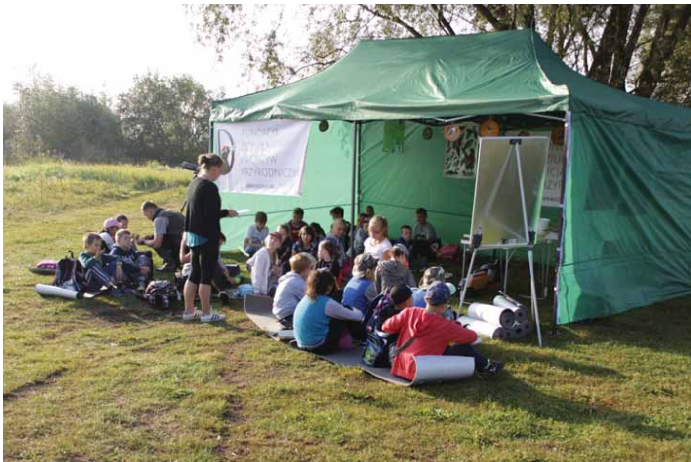
Fundacja Dziupla Inicjatyw Przyrodniczych uczyła najmłodszych rozpoznawać ptaki.