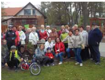
Budachów 3 maja 2017 r.