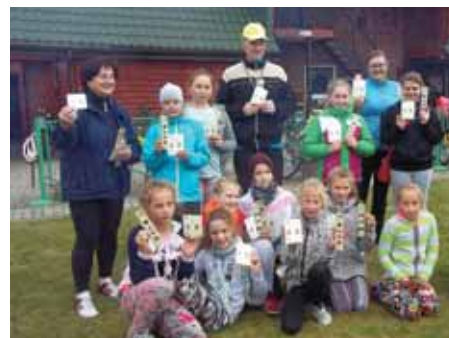
Jesienny rajd rowerowy 2016 r.